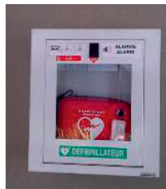
Un défibrillateur installé en lycée

L'objectif de cet exercice est de comprendre le fonctionnement d'un défibrillateur au travers d'un modèle simplifié.