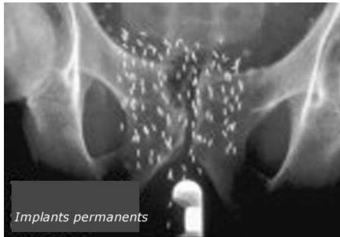
Radiographie du bassin d'un patient traité par curiethérapie. Les implants apparaissent sous forme de bâtonnets blancs.

Evolution de la radioactivité des implants en fonction du temps