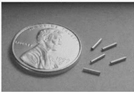
Implants contenant de l'iode-125 utilisés en curiethérapie de la prostate

La curiethérapie de la prostate consiste à installer directement dans l'organe des implants radioactifs constitués d'une source radioactive enrobée dans une capsule de titane. Un radioélément utilisé est l'iode-125. De 40 à 130 implants sont installés dans la prostate, le nombre étant déterminé par le volume de la prostate à traiter. Ces implants restent à demeure.