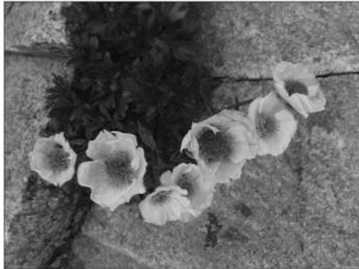
Photographie de renoncules des glaciers enracinées entre des pierres

2012 : deux des trois espèces végétales perdurent. On observe aussi le net recul du glacier Carré libérant un espace rocailleux colonisé par une nouvelle population de renoncules des glaciers ( Ranunculus glacialis ). La renoncule des glaciers est la renoncule d'altitude par excellence. Elle pousse par petits groupes dans les pierriers et sols instables.