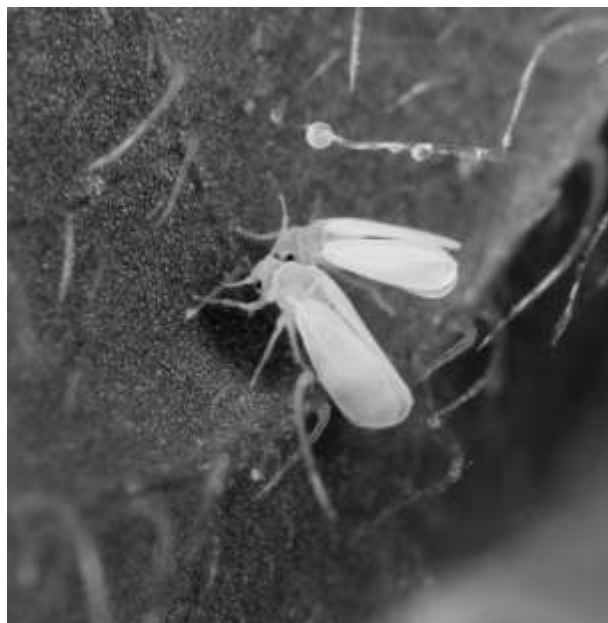
Aleurodes du tabac adultes, suçant la sève d'une feuille

Les documents 1 à 3 utiles pour répondre aux questions posées sont proposés sur les pages suivantes.