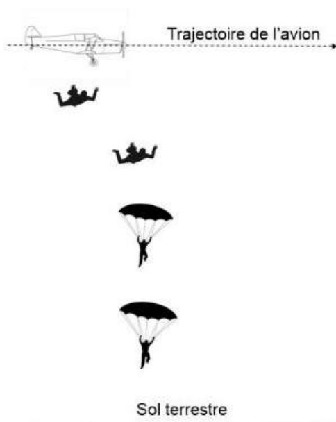
Saut depuis un avion