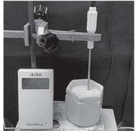
Mesure de la température lors de la fabrication d'un yaourt

L'objectif de l'exercice est d'étudier une condition sur la grandeur température nécessaire pour le bon déroulement de la fermentation. Pour cela, on réalise l'expérience qui consiste à mesurer l'évolution de la température du lait au cours du temps lors de la phase de fermentation.