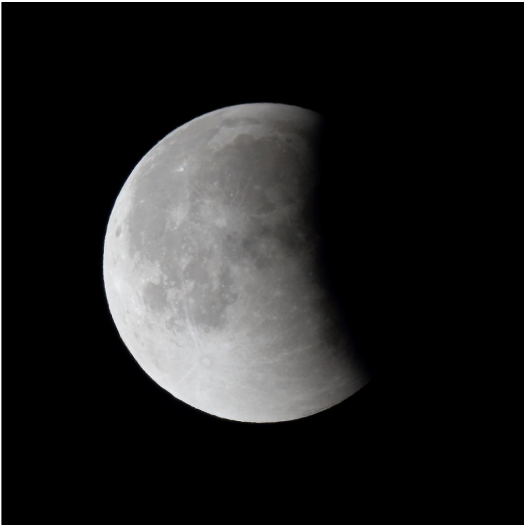
Éclipse de Lune