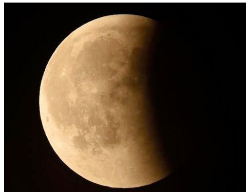
Éclipse de lune du 19 janvier 2019 à Chambord

Il suppose par ailleurs que l'ombre de la Terre sur la Lune a la même taille que la Terre, ce qui revient à considérer que les rayons du Soleil sont parallèles entre eux.