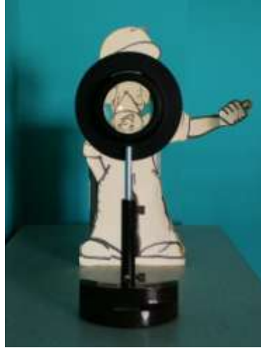
Photographie 2 : première expérience réalisée au laboratoire

Lors de la prise de vue, la distance entre la lentille (L) et le personnage est de 33,0 cm.