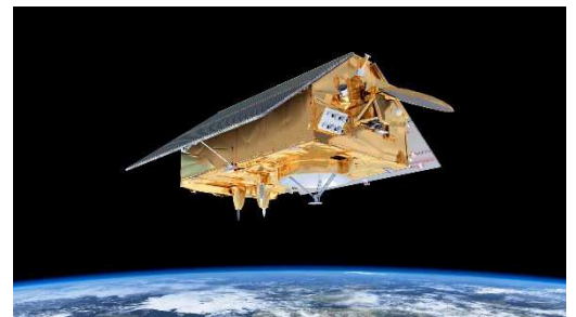
Figure 1. Satellite Jason-CS/Sentinel-6