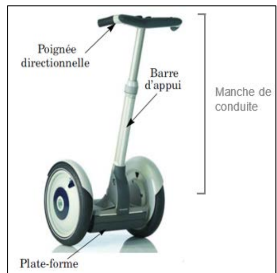
Figure 1. Gyropode.

La masse totale du système {gyropode et conducteur} a pour valeur 110 kg.