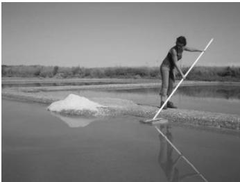
D'après OT La Turballe

Les marais salants permettent de produire du sel marin. Pour cela, on fait entrer de l'eau de mer dans des bassins de faible profondeur. Sous l'effet du soleil et du vent, l'eau s'évapore. On peut alors facilement récolter le sel marin.