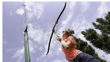
Figure 1 : Tir à l'arc vertical

Le tir à l'arc à la perche verticale est très répandu dans la région des Hauts de France où il est pratiqué sur des terrains prévus à cet effet ( figure 1 ). L'histoire de la pratique dans cette région remonte au moyen âge et à la guerre de cent ans quand l'archerie perfectionnée par les Anglais était propagée dans le territoire.