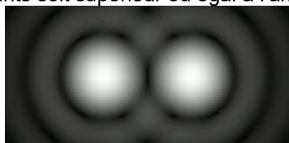
\theta' > \alpha : les deux points peuvent être discernés

La lunette astronomique permet de distinguer deux points à condition que l'écart angulaire \theta' entre ces deux points soit supérieur ou égal à l'angle \alpha (voir figures ci-dessous)