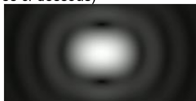
\theta' \leq \alpha : les deux points ne peuvent pas être discernés