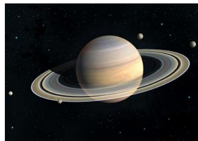
Illustration tirée de : starwalk.space/fr

L'une des lunes les plus proches de Saturne est Janus, découverte en 1966 par plusieurs astronomes dont le français Audouin Dollfus (1924 – 2010).