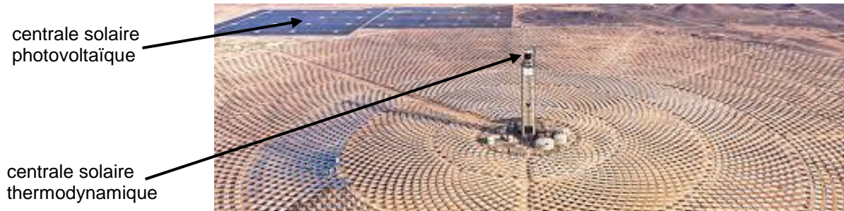
Figure 1 – Centrale solaire « Cerro Dominador » dans le désert d'Atacama.

La plus grande centrale solaire d'Amérique du Sud se situe dans le désert d'Atacama au Chili. Elle combine deux infrastructures : une centrale solaire photovoltaïque et une centrale solaire thermodynamique ( figure 1 ).