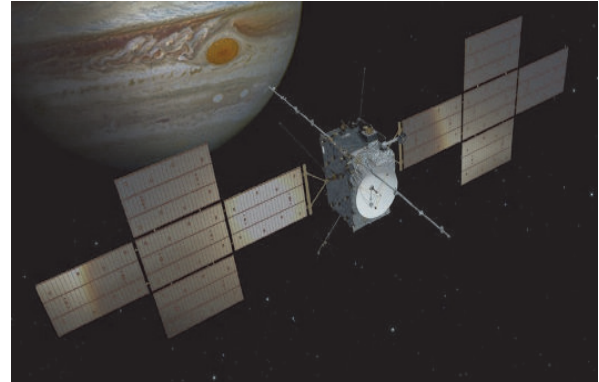
Figure 1. Vue d'artiste de la sonde JUICE avec Jupiter en arrière-plan.